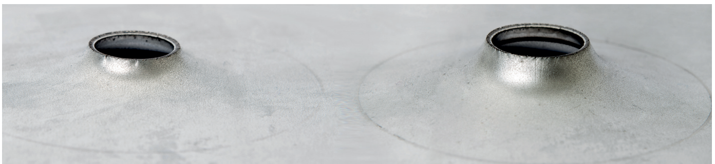
Das optimierte Umformverhalten von xpanse®-Stählen lässt sich an Proben eines Lochaufweitungstests (siehe oben) erkennen. / The above samples of a hole expansion test demonstrate the optimized formability of xpanse® steels.