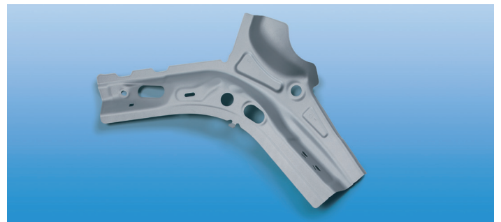
Der Sitzquerträger aus HCT590X+Z (links) sowie die D-Säulenverstärkung aus HCT590Xexpand®+Z (rechts) veranschaulichen das große Einsatzfeld der Dualphasenstähle aus Salzgitter. / The seat crossmember made of HCT590X+Z (left) and the D-pillar reinforcement made of HCT590Xexpand®+Z (right) illustrate the large range of applications for dual phase steels from Salzgitter.